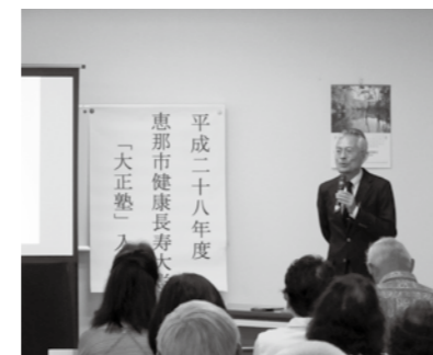
▲大正塾を受講する