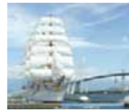
新湊漁港周辺(新湊大橋と帆船海王丸)

7月5日の「富山・岐阜交流の日」にちなみ、富山県の魅力に触れる日帰りバスツアーを行います。今年は富山市ガラス美術館や射水市の新湊漁港を訪れます。