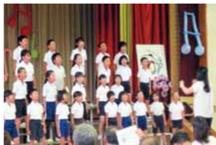
▲体育館に響き渡る歌声

地元子ども園児の歌や小学校児童・PTAの合唱、地元サークルのマンダリン、バイオリン演奏などが行われます。