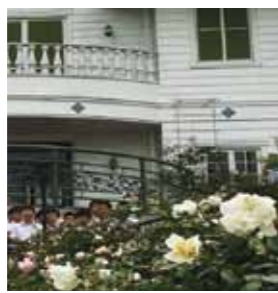
▲ロマン館前のバラ