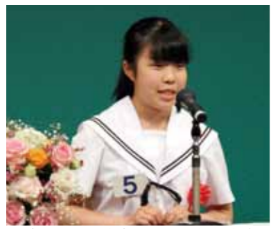
▲熱い思いを発表する=昨年の大会

今年「社会や世界に向けての意見、未来への希望や提案」「家庭、学校生活、社会(地域活動)及び身の回りや友達との関わり」などに特別テーマ「ふるさと」の先人に学んだこと」を加えた、五つのテーマのうちから、5分間で意見を発表します。