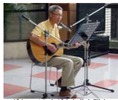
▲ギターでさまざまな曲を弾く