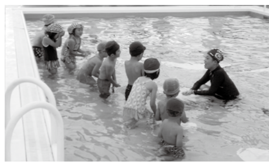
▲みんなで楽しく水泳教室

子ども元気プラザのイベント わくわく夏祭り 夏祭りの雰囲気を楽しみながら、親子の触れ合いを深めませんか。祭りの手伝いをしてもらえるボランティアスタッフも募集します。