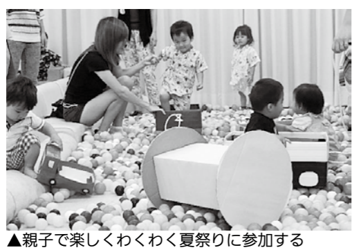
▲親子で楽しくわくわく夏祭りに参加する