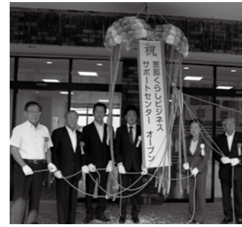
▲オープニングセレモニー

8月29日にオープンした恵那くらしビジネスサポートセンターでは、ビジネスと移住の相談を一体で受け付けています。「売り上げをアップしたい」「優秀な人材を育てたい」「恵那市で働きたい」「空き家を探したい」など、ビジネスとくらしの相談に、専門スタッフが対応します。