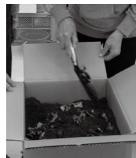
▲生ごみを処理する

30センチ四方の段ボール箱で、約3カ月分の生ごみを処理できます。臭いや汁漏れの心配が無く軽いので、ごみ出しが楽になります。 日時 10月7日(土)午前9時半～11時 場所 ふれあいエコプラザ(長島町) 定員 10人(先着順) 料金 ▽市民II補助により無料 ▽市外の方II200円 ※材料費として別途500円程度が必要 申し込み ふれあいエコプラザ ☎ 25-1515(月・火曜日休館)