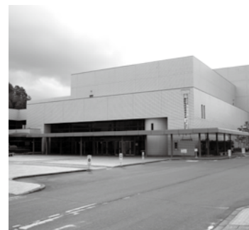
▲恵那文化センター

案内 恵那文化センターでは、3月9日(金)から11日(日)まで恵那文化まつりを開催します。市内の各コミセンを中心に活動する認定生涯学習活動団体が、展示やステージ発表を行います。 展示部門 □とき 3月9日(金)~11日(日) 午前9時~午後5時 ※11日は午後3時まで □内容 書道、華道、絵画、写真、七宝焼などの展示、七宝焼の即売(11日午前9時半から)。煎茶席(11日午前10時から先着100席)。