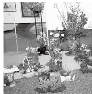
▲恵那文化まつり展示部門

◎催しの予定は変更になる場合があります。詳細は主催者へお尋ねください。 ◎駐車場には限りがあります。来館の際は、車の乗り合わせや公共交通機関を利用ください。