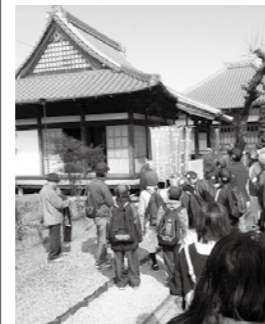
▲地区の史跡を巡る

町民「ぞって歩」ついで会 三郷町椋実地区の史跡を巡りながら、ふるさとを見直しませんか。ゴールの寿老の滝駐車場では、豚汁の振る舞いや五平餅の販売があります。