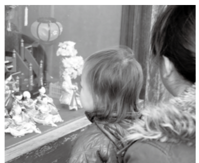
▲おひなさまを見ながら散歩する

昔からおひなさまが飾られる時期になると、子どもたちが「おひなさまを見せて」と家々を回り、お菓子をもらう風習があります。岩村城下町の町並みに飾ってあるおひなさまを見学しながら、みんなが楽しく散歩しませんか。 □とき 3月2日(金)、28日(水)午前10時半出発(受け付け開始は午前10時15分) □ところ こぎつねの森集合 □定員 15組の親子(先着順) □料金 無料