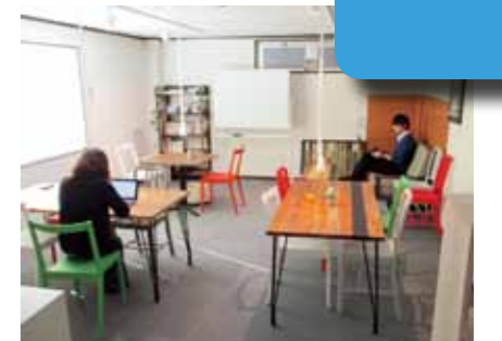
▲2階にあるコワーキングスペース

自宅以外にオフィスを持ちたい。みんなが集まっている作業場がほしい。そんな要望に応えるため、当センターの2階には、コワーキングスペースがあります。読み取って確認ください。