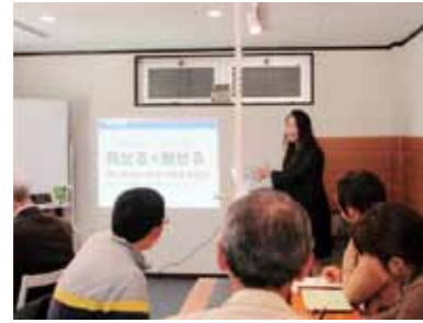
▲採用担当者向けのセミナー

市内の企業採用活動を支援します。市主催の合同企業説明会はもちろん、採用のための勉強会や、企業が必要とする人材などの基礎データの作成も行っています。