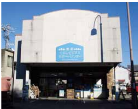
▲サポートセンターの外観

■ 駐車場 センター 建物前無料駐車場ス ペース3台 ※満車の場合は、周 辺の民間駐車場を利 用ください（90分ま で無料。90分を超え る場合は30分ごと に60〜70円が必要） ■ 公共交通機関利用の 場合 JR恵那駅か ら南へ徒歩3分