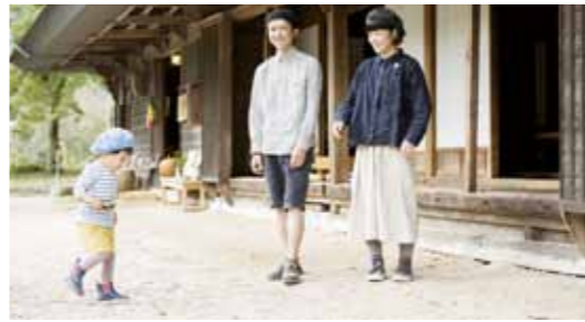
▲空き家を活用して移住

田舎暮らしやUターンを目的として恵那で暮らしたい方や、既に恵那に住んでいる方の移住定住相談を行っています。住まいや病院などのインフラ情報から気になる地元情報、市内にある企業への就職相談や補助金情報まで相談できます。