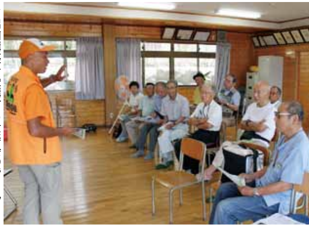
▶ 出前講座を受講する壮寿会の皆さん

最近では農作物以外にも人への危害や自動車との衝突事故、家屋の屋根裏への侵入などの被害が広がっています。野生動物への被害対策は、