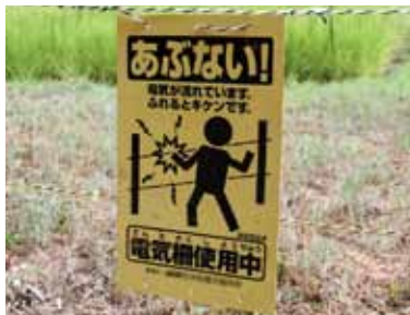
▲看板を設置して注意を促す！

農作物被害防止のため田や畑に電気柵を設置することは有効です。しかし、不用意に触れると感電する恐れがありますので、電気柵には絶対に近づかないようにしてください。電気柵を設置して