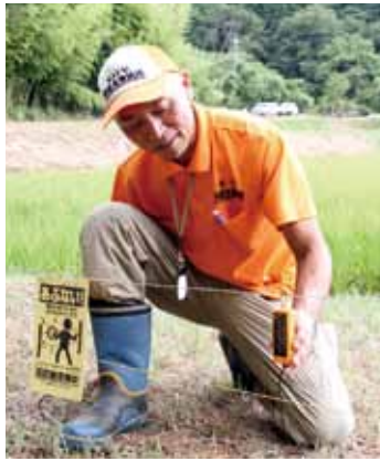
▲定期的に除草と電柵の点検を！

野生動物の水田や農地への侵入防止策として、効果の高い対策が電気柵の設置です。ただし、日中は電源が切れている場合が多いため、侵入