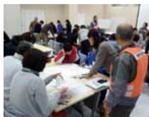
▲グループで学習し合う

□申し込み方法 申込書を記入の 上、危機管理課または各振興事務所 へ持参するか郵送、ファクス、電子 メールで申し込む。申込書は危機