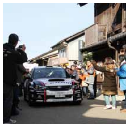
▲初開催の昨年は8,000人が観戦

□内容 インフォメーションでの案 内、会場内での観戦者の誘導、駐車 場の誘導など