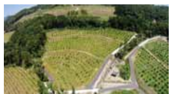
▲笠置山栗園は20畝もあり、日本一の栗園を目指しているんだナ!

恵那市や中津川市では、栗の栽培が盛んなんだナ。その歴史は古くて、大正の初めごろ、農業を始めようと開墾をした人が稲作と同じくらいの収益を目指して、野菜や果樹などいろいろ栽培したんだナ。ただなかなかうまくいかなくて、試行錯誤を繰り返してようやくたどり着いたのが、栗栽培だったんだナ。やがてその人を見習って栗の栽培を始める人が徐々に加え、今では恵那・中津川地域は岐阜県で一番の栗産地(岐阜県は全国第4位)になったんだナ。恵那で栽培される栗は、岐阜県方式という木の高さを低くした低樹高・超低樹高栽培。はしごなどを使わなくても枝に直接手が届き、管理しやすいように剪定されているんだナ。こうすることで大きくて質の良い栗を作ることができ、その多くが地元のお菓子屋さんで使われているんだナ。