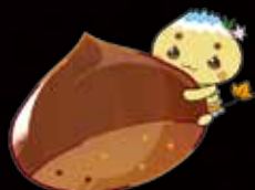
市公式キャラクター 「エーナ」