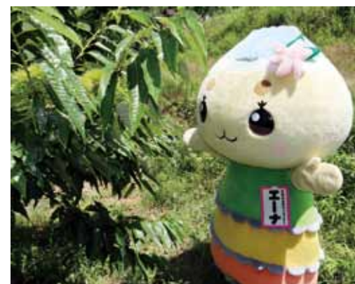
▲もうすぐおいしい栗が採れるんだナ!

恵那市や中津川市では、栗の栽培が盛んなんだナ。その歴史は古くて、大正の初めごろ、農業を始めようと開墾をした人が稲作と同じくらいの収益を目指して、野菜や果樹などいろいろ栽培したんだナ。ただなかなかうまくいかなくて、試行錯誤を繰り返してようやくたどり着いたのが、栗栽培だったんだナ。やがてその人を見習って栗の栽培を始める人が徐々に加え、今では恵那・中津川地域は岐阜県で一番の栗産地(岐阜県は全国第4位)になったんだナ。恵那で栽培される栗は、岐阜県方式という木の高さを低くした低樹高・超低樹高栽培。はしごなどを使わなくても枝に直接手が届き、管理しやすいように剪定されているんだナ。こうすることで大きくて質の良い栗を作ることができ、その多くが地元のお菓子屋さんで使われているんだナ。