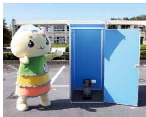
▲これがマンホールトイレなんだナ！

マンホールトイレとは、災害時に下水道管路にあるマンホールの上に簡単なトイレ設備を設け、使用するトイレのことなんだナ！ 地震などによる大規模災害が発生すると、水道管が壊れて水が出なくなり、水洗トイレの多くが使用できなくなるがあるんだナ。そうすると、トイレに行くのを我慢したり、水分を取らないようにしたりして、体調が悪くなる人が多くいるんだナ。マンホールトイレは、災害が発生した時でも、段際の無い環境で使用できるので、避難所などで設置が進んでいるんだナ。実際に東日本大震災や熊本地震で、避難所に整備したマンホールトイレが使われ、被災者から好評だったんだって。