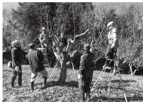
▲クリの木の枝切りを学ぶ受講者