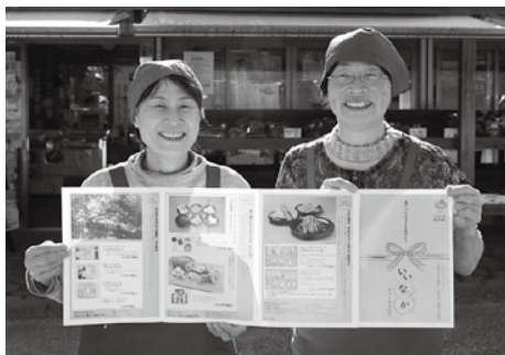
▲いいなかギフトカタログ

期間 12月3日(月)〜12月28日(金) 提出方法 ①表題「都市再生整備計画事後評価(案)」②住所③氏名④電話番号⑤