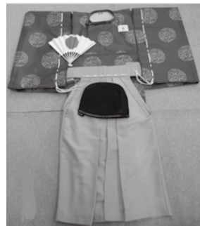
▲大祭で使用する古式装束