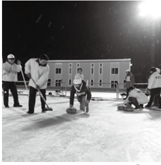
▲氷上で楽しむカーリング

七日市の交通規制に該当する収集地区(大井町の一部)は、収集日を平成31年1月7日(月)から1月6日(日)に変更します。 八日市の交通規制に該当する収集地区(岩村町の一部)は、収集日を1月8日(火)から1月9日(水)に変更します。 当該地区の詳細については、市ウェブサイトを確認するか、環境課に問い合わせください。 ☎ 環境課(内線209)