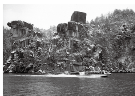
▲雪景色の中を走る遊覧船

期間 12月1日(土)〜平成31年2月28日(木) 料金 ▽一般1740円(通常1480円) ▽小学生以下1370円(通常740円) 観光交流課(内線386)、恵那峡遊覧船 ☎25-4800