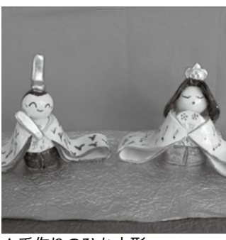
▲手作りのひな人形

一般財団法人沖永文化振興財団では、伝統民俗芸能活動に対する助成をしています。 □対象 ①国内の芸術文化団体が主催か、他の団体と共催などで実施する伝統民俗芸能公演や公開事業 ②国内の芸術文化団体が個人が実施する伝統民俗芸能の保存伝習事業 ※助成対象となる費用は事業運営に必要な物品や用具、衣装等の購入や修理に必要な費用とし、旅費や会議費、通信費、人件費等の経費は含めません。