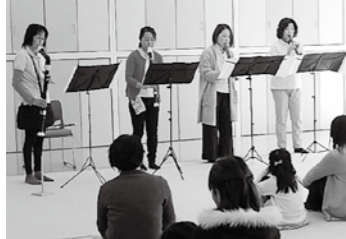
▲親子で音色を楽しむ