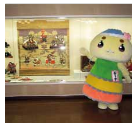
▲大型押絵びな掛け軸は見ものなんだナ！

大正時代を思わせる白い洋館の大正ロマン館では、大正村所蔵ひな飾りと題して、いろいろなひな人形を展示しているんだナ。国内最大級の大型押絵びな掛け軸をはじめ、押絵びなや掛け軸びな、明治大正時代から伝わる内裏びなが展示されているんだナ。よく見る段飾りのひな人形と違って、大型押絵びな掛け軸は、押絵の技術が使われていて、掛軸なのにおひなさまの衣装が立体的になっているのが見所なんだナ！