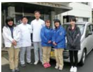
▲私たちが訪問します！

看護師は訪問看護に24時間対応し、夜間・休日などの緊急訪問も行っています。また、電話での相談にも応じています。