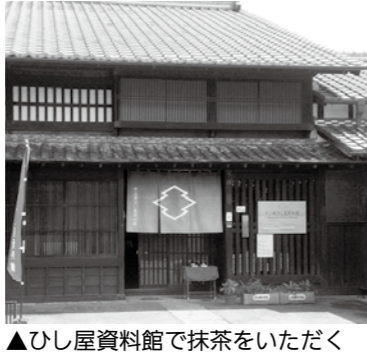
▲ひし屋資料館で抹茶をいただく

□とき 5月12日(日)午前10時～午後3時 □ところ 中山道ひし屋資料館(大井町) □定員 20人(先着順) □料金 一服100円(菓子付き) ※入館料は無料 □生涯学習課(内線472)