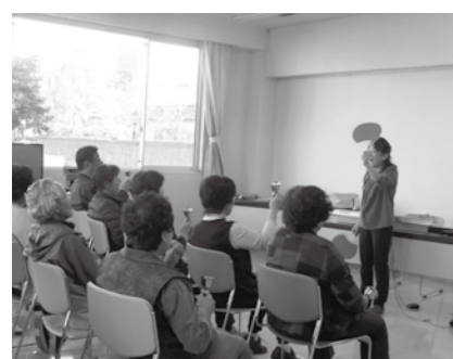
▲音楽療法を学ぶ受講生

□定員 各25人 □料金 無料 □持ち物 水着、水泳帽子 □申し込み方法 任意様式に ①氏名②住所③電話番号④生年月日⑤職業⑥応募理由―を記入し持参か郵送、メールで申し込む。 □申込期限 5月22日(水) ☎・問 〒509-7121 武並町藤2403-9 NPO法人市手話通訳連絡会 ☎28-11008、✉keituren@gmail.com 高齢者支え合いガイドブックの広告主 市では、高齢者支え合い活動ガイドブック『えーな みんなで助け合い』の広告主を募集します。 この冊子は、高齢者の社会参加や生活支援の充実を図るために、市民への啓発を目的として発行します。地域の生活支援情報その他に、医療機関や事業所などの広告を紙面に掲載することで、発行費用をまかさないです。また事業所などの広告宣伝活動にも貢献する目的も込め、作成します。 □申込期限 5月31日(金)