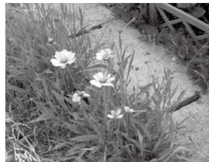
▲オオキンケイギク