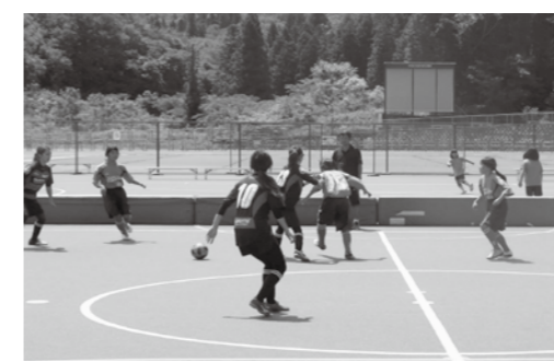
▲昨年のフットサルレディース大会

□定員 各25人 □料金 無料 □持ち物 水着、水泳帽子 □申し込み方法 任意様式に ①氏名②住所③電話番号④生年月日⑤職業⑥応募理由―を記入し持参か郵送、メールで申し込む。 □申込期限 5月22日(水) ☎・問 〒509-7121 武並町藤2403-9 NPO法人市手話通訳連絡会 ☎28-11008、✉keituren@gmail.com 高齢者支え合いガイドブックの広告主 市では、高齢者支え合い活動ガイドブック『えーな みんなで助け合い』の広告主を募集します。 この冊子は、高齢者の社会参加や生活支援の充実を図るために、市民への啓発を目的として発行します。地域の生活支援情報その他に、医療機関や事業所などの広告を紙面に掲載することで、発行費用をまかさないです。また事業所などの広告宣伝活動にも貢献する目的も込め、作成します。 □申込期限 5月31日(金)