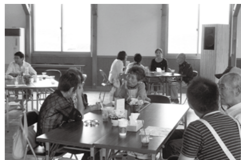
▲昨年のささゆりカフェ