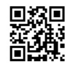
▲工場見学などの詳細は、恵那楽器のウェブサイト!