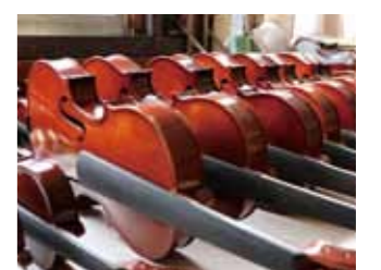
▲とってもきれいなバイオリンなんだナ!