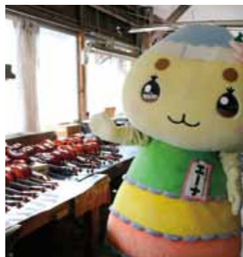
▲バイオリンをたくさん作っているんだナ!

中野方町の自然の中にある恵那楽器株式会社さんへ行ったんだナ! この会社では、バイオリンやマンドリン、チェロ、ビオラなどの弦楽器を作っていて、主力製品のバイオリンは、月に150本も作っているんだナ。全国でも珍しい弦楽器の量産工場を持っていて、素材となる板の切り出しから、組み立て、塗装、仕上げ作業までを一貫して行っているんだナ。