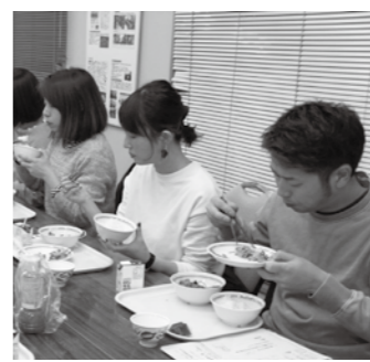
▲学校給食を味わう参加者

学校給食を身近に感じてもらうため、学校給食センターでは、学校給食フェアを開催します。施設の見学や地元食材を使った給食の試食会を行います。この機会に、ぜひ参加ください。 施設見学 □ とき 1月27日(月)、28日(火) 午前9時半～正午 □ ところ 市学校給食センター(大井町) □ 内容 調理施設の見学、学校給食衛生管理についての展示 試食会と給食の話 □ ところ・とき △市学校給食センター △1月27日(月)、28日(火) 午前11時45分～午後0時45分 ▽ 岩村こども園(岩村学校給食センター)、山岡学校給食センター、明智学校給食センター △1月28日(火) 正午～午後1時 □ 定員 各15人(先着順) ※市学校給食センターは各日25人(先着順) □ 料金 286円(給食費)