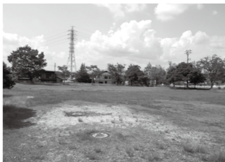
▲住宅分譲に適した広大な土地

市では、定住人口の増加を図るため、戸建て住宅用地の分譲を目的とした、公募型プロポーザル方式による市有地の売却を行います。 分譲住宅地 □ ところ 大井町字北関戸地内(旧大井ふれあい運動広場) □ 面積 約3000平方メートル □ 対象 住宅分譲地の供給実績がある事業者 ※その他要件有り □ 申込期間 1月7日(火)～31日(金) □ その他 条件や申し込み方法など、詳しくは市ウェブサイトを確認ください。 問 都市住宅課(内線246)