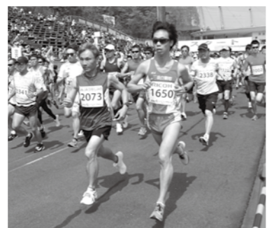
▲春の恵那を走る爽快なコース

認知症の方や家族など、誰でも参加できます。 □とき 1月22日(水)午後2時~4時