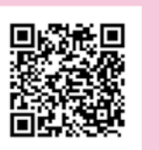
▲ダウンロードページ