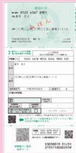
通知カードと交付申請書

申請完了後、1カ月ほどすると市から交付通知書を送付します。 交付通知書に記載の必要書類を持参し、市民課窓口でマイナンバーカードを受け取ってください。