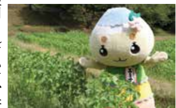
▲エゴマの畑に行ってきたんだナ!

まれているんだ。他にもイノシン酸などがエゴマの葉っぱのおいさを嫌うから、野生動物による被害(獣害)を受けにくい作物としても注目されていて、耕作放棄地を解消する救世主として期待されているんだナ。 市でも栽培の普及に力を入れていて、高校生や料理人など、たくさんの方が連携して、エゴマを使った料理レシピを考えたり、生産者の組合の設立を手伝ったりしているんだよ。エゴマに興味がある方や獣害に悩まされている方、耕作放棄地を解消したい方は、エゴマの栽培にチャレンジしてほしいんだナ。