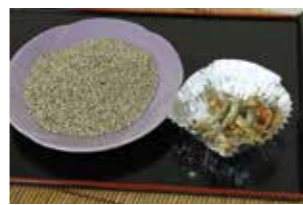
▲いろいろな料理に使えるんだナ

みんなは「エゴマ」って知ってるかな? エゴマはシソ科の一年草で歴史は古く、縄文時代から食べられていたといわれているんだ。エゴマから搾った油は食用だけじゃなく、灯りや防水塗料などにも使われているんだよ。日本で油といえばエゴマというほど有名だったんだけど、菜種油の普及で徐々に知名度が低くなっていったんだ。 ところが近年、健康食材としてエゴマが注目されているんだナ。エゴマにはα-リノレン酸という人間にとって必須の脂肪酸がたくさん含まれているんだ。