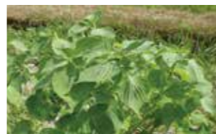
▲これがエゴマの葉だよ