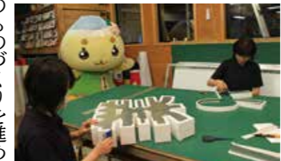
▲手仕事で丁寧に仕上げているんだナ！

子ども園や明知鉄道極楽駅など、いろいろな場所でもアド・ループが作った看板やサインを見ることができるとだよ。 最新の機械による最先端のものづくりを進めながらも、手作りならではの味を大切にしているから、仕上げは一つ一つ丁寧な手仕事なんだ。 さらに、看板を表す最古の言葉から名付けた自社ブランド「肆」を展開していくんだって。アド・ループが手掛ける魅力的なデザインが、市内はもろろろ全国にあふれ、楽しい景色が増えていくことを期待しているんだナ！ 問 商工課（内線393）