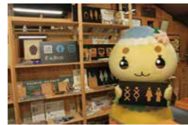
▲いろいろなデザインのサインができるよ

大井町にある有限会社アド・ループへ行ってきたんだナ！この会社では看板の制作を中心として、店づくりの企画からデザイン、施工管理まで一貫してやっているんだよ。いろいろな部署が密接に連携している、ブレない仕事ができるから、発注者の思いをそのまま製品に反映できるんだって！ 創業は38年前、社長が筆一本でお店の図面を引き始めたのが会社の始まりなんだって。「一生懸命」をずっと大事にして、店の顔づくりをトータルで任せられる会社になったんだナ！ 今ではお店だけでなく、おしま二葉