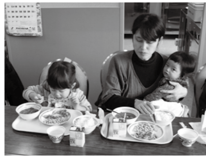
▲温かい給食を試食する

学校給食を身近に感じてもらうため、施設の紹介や地元食材を使った給食の試食会を行います。 施設自由見学 □とき 1月25日(月)、26日(火) 午前9時半〜正午 □ところ 市学校給食センター □内容 調理施設の見学、衛生管理に関する展示 試食会と給食の話 □ところ・とき ▽市学校給食センター 1月25日(月)、26日(火) 午前11時45分〜午後0時45分 ▽山岡学校給食センター、明智学校給食センター 1月26日(火) 正午〜午後1時 □定員 各6人(先着順) ※市学校給食センターは各日10人(先着順) □料金 286円(給食費)