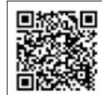
▲恵那スケート場ウェブサイト

12月31日(木)は午後4時まで、1月1日(金)は午前10時から営業します。 ※来場前にウェブサイトから予約をお願いします