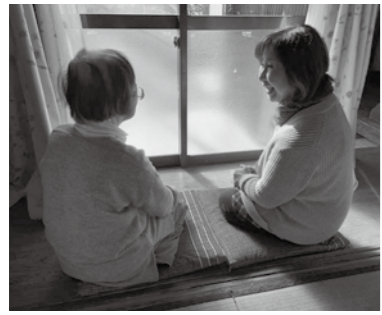
▲おしゃべりで気分転換

思い出話の会 思い出の品物をテーマに、昔の話をしてながら脳を動かして、認知症予防をしませんか。申し込みは不要です。 ☎とき 1月23日(土)午後1時半～3時 ☎料金 無料 おもいでカフェ 回想法をしながら、仲間づくりや介護予防しませんか。自分の思い出などを話しましょう。申し込みは不要です。