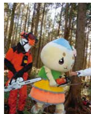
▲チェーンソーはずっしりと重いんだナ!

チェーンソーって何か知ってる? チェーンソーは、たくさん小さな刃が付いたチェーンをエンジンなどの動力で動かして、短時間で木を切ることができる便利な道具なんだ。でも、操作を間違えると、大きなけがをしてしまう危険もあるんだ。 エーナは、11月に開かれたチェーンソー間伐初級講座に参加して、大きな木を切るのに必要なことを勉強してきたよ。チェーンソーを扱うときは、ヘルメットと防護服、防護メガネなど、自分を守るための装備を