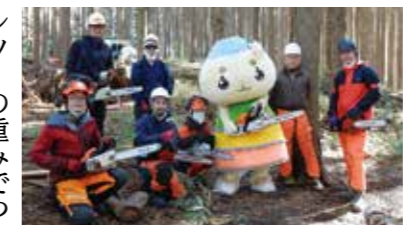
▲NPO法人夕立山森林塾の講師(左から1人目)と受講生の皆さん。

身に付けることが大切なんだ。例えば、チェーンソーの刃が木に触れた瞬間に、刃が体の方向に跳ね返ってけがをしたり、チェーンソーの重みでついで足を切ってしまうたりすることがあるんだ。それから、木を切っているときに、突然木が裂けたり、切り倒した木が、地面などに当たって跳ね上がったたりして、作業をしている人に激突する事故も多いんだって。みんなもチェーンソーを使うときは、安全装備と正しい操作方法の知識を身に付けて、慎重に作業を行ってほしいんだナ。 林政課 (内線 415)