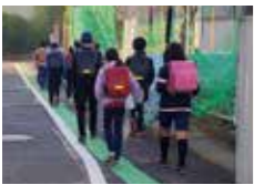
▲通学路に整備したグリーンライン

子どもたちが安全に通学するため、通学路にグリーンラインを整備します(3900畝)。