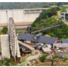
▲おばあちゃん市・山岡