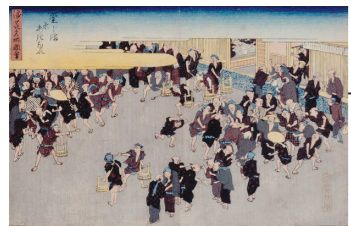
《浪花名所図会》 「堂じま米あきない」 1834（天保5）年ころ 歌川広重

江戸時代における「三都」とは「京」、「大坂」、「江戸」のことをいいます。図は「堂じま米あきない」です。堂島米会所は、現代の基本的な先物市場の先駆け、世界初の整備された先物取引場であり、「天下の台所」と称された大坂らしい情景として描かれています。 6月3日（日）、7月1日（日）は、市民の日（市民に限り観覧料が無料です。当日、受付係に「恵那市民です」とお伝えください） 問 中山道広重美術館 ☎ 20-0522