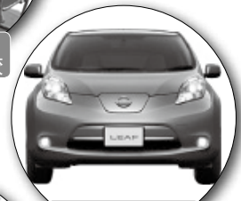
電気自動車の 展示試乗