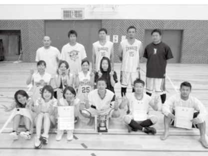
▲バスケットボールで総合優勝した皆さん