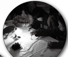
花の色素で作る 太陽電池