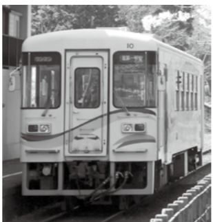
▲明鉄の車内で昔を懐かしむ