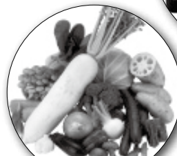
新鮮野菜の 即売会

☐問い合わせ えな環境フェア2011実行委員会(環境課内) ☎26-2111(内線185)