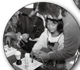
手回し発電で エネルギー比較