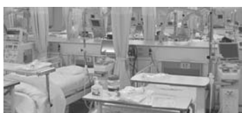
透析設備のイメージ

同センターは、20床で外来通院の方を対象とし、平成21年度は、月・水・金曜日の午前みの運営となります。今後は、徐々に職員数を増やし、将来的に定員60人の受け入れを想定しています。