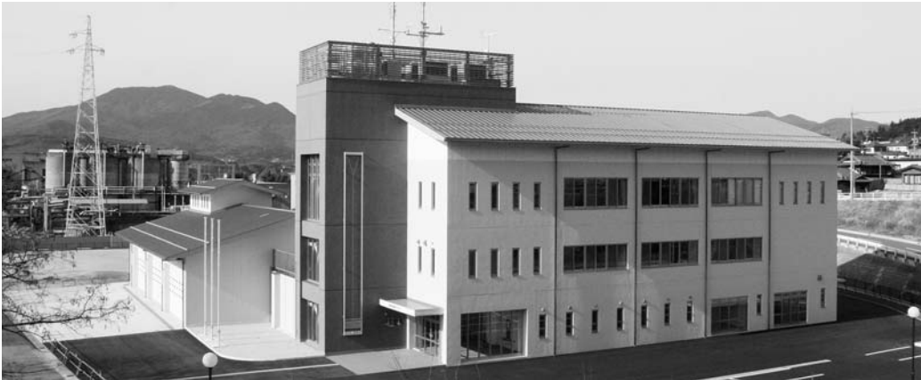
新しく完成した市消防防災センター