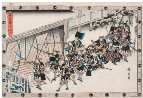
歌川広重「忠臣蔵 夜打二 乱入」 当館蔵（田中コレクション）