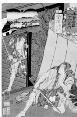
歌川国芳 「木曾街道六十九次之内 今須 曾我兄弟」 当館蔵 (田中コレクション)