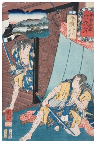
歌川国芳「木曾街道六十九次之内 今須 曾我兄弟」 当館蔵（田中コレクション）