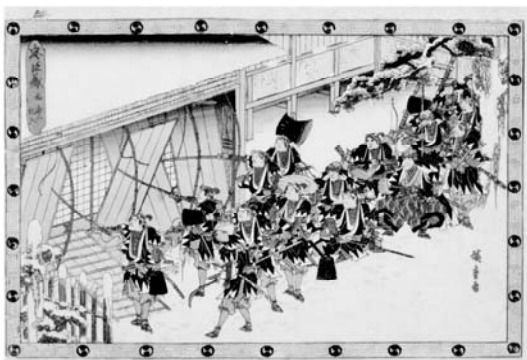
歌川広重「忠臣蔵 夜打二 乱入」 当館蔵(田中コレクション)