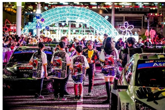
昨年のオープニングセレモニーの様子