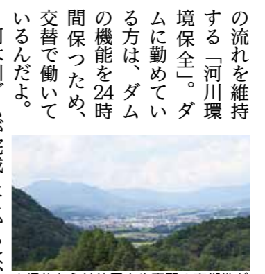
▲堤体からは笠置山や恵那の市街地が見えるんだナ!

阿木川ダムが完成してからは、下流で川の水があふれたことはなく、みんな安心して暮らせるようになったんだ。でも最近では、経験したことのない強い雨が降るようになったから、油断はできないんだナ。阿木川湖の周りは緑豊かな公園や周遊道路があつて、散歩やハイキングに最適なんだ。食堂ではおいしい「阿木川ダム湖カレー」も食べられるよ。みんなも阿木川ダムに遊びに行つてほしいんだナ。