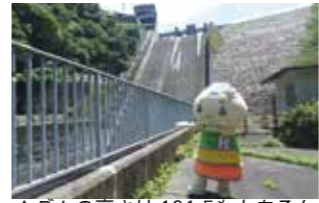
▲ダムの高さは101.5mもあるんだナ!

秋の晴れた絶好のお出掛け日和。街を流れる阿木川の上流、東野にある阿木川ダムに行ってきたんだ。このダムは、1991 (平成3) 年3月に完成。同じ年の4月から管理を始め、今年で30年を迎えたんだ。みんなは、阿木川ダムが何のために造られたか知ってる？ ダムには三つの役割があるんだよ。一つ目は、台風などで大雨が降ったとき、一時的に水を貯めて下流域を洪水から守る「洪水調節」。二つ目は、長く雨が降らず川の流が少なくなつたときに、貯めている水を下流に流して、家庭や工場が水を使えるようにする「利水」。三つ目は、川の生き物が元気をなくさないように、川