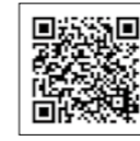
▲市ウェブサイト3回目接種のページ

※12月16日時点の情報で作成しています 問 新型コロナウィルスワクチン接種推進室（市役所北庁舎） ☎26-2111（内線542）