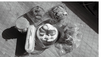
▲イチゴを使った関連商品

※売り切れ次第終了します □とき 3月15日(土)午前10時～正午 □ところ 市中央図書館前 📠 農政課📠26-6831