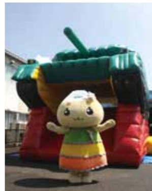
▲エーナも大好きなエアードームなんだナ！

健幸フェスタや恵那スケート場のエアードームで遊んだことあるかな？いろいろなイベント会場で大人気のエアードームを提供している、株式会社セルバさん（大井町）に行ってみよう。