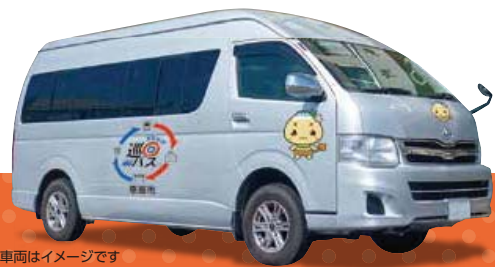
※車両はイメージです

6月1日(水)から、これまでの恵那病院線がもっと便利に「まちなか巡回バス」として生まれ変わります。皆様の生活に不可欠な病院、お買い物施設を巡りますのでお気軽にご利用ください。