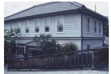
景観重要建造物指定候補例 (大正村役場)