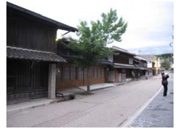
景観形成重点地区候補例 (大井宿の歴史的町並み地区)

本市を代表するような特徴的な景観を有している地区や、住民自らが積極的に景観形成に取り組もうとしている地区を対象に、住民等の合意形成に基づき、より重点的に景観形成に取り組む『景観形成重点地区』に指定します。景観形成重点地区では、恵那市景観計画との整合性を図りながら、地区独自の基準による届出制度の運用や景観形成住民協定の適用、景観地区・準景観地区への位置づけなど、景観法等に基づく諸制度の活用により、積極的な景観形成を進めていきます。