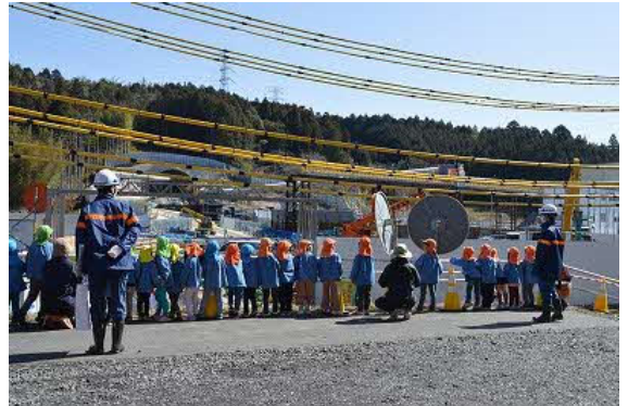
武並こども園見学会

今後も、地元に寄り添って工事を進めてまいりますので、どうぞ宜しくお願い致します。