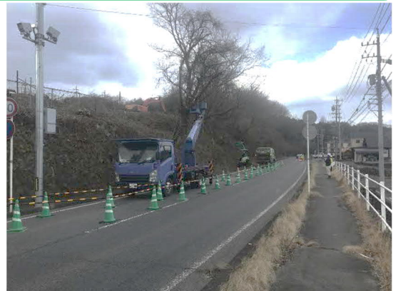
県道側伐採作業状況