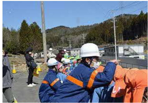
武並こども園見学会

3月14日（火）に、武並こども園の遠足の中で現場見学会を開催し、皆さんに喜んでいただきました。