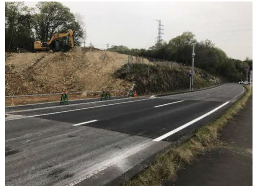
県道側工事車両出入口