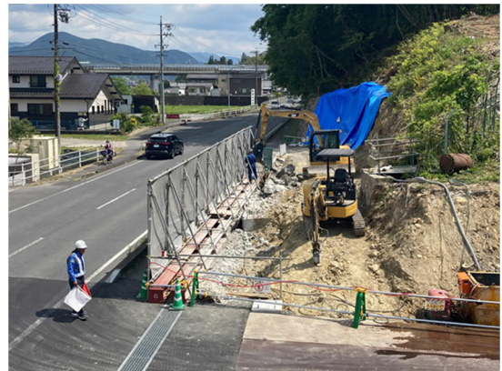
県道側擁壁取壊し状況

6/20～6/22に、トンネル掘削作業時の発生土運搬台数を想定したダンプの試験走行を行い、周辺交通への影響確認を行います。この3日間は普段よりダンプの台数が増加します。安全運転で運行しますのでどうぞよろしくお願いいたします。