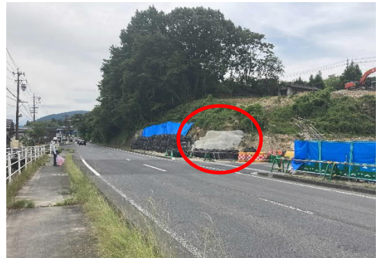
水路補強工事完了

6月2日の台風による豪雨の際は、現場内の既設水路に降雨による大量の雨水が流入して越流し、現場前の県道等に雨水が流出してしまいました。周辺にお住まいの方々をはじめ地域の皆様には大変なご迷惑をおかけしました。当該水路については、同じことが起きないように、早急に補強工事を行いました。