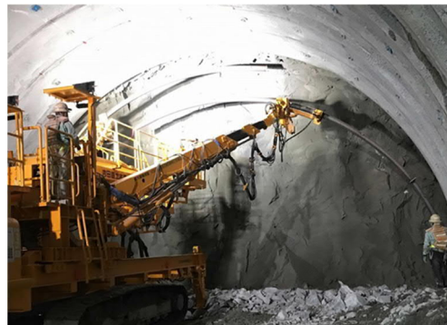
トンネル掘削作業状況

工事用道路移設工事については、田尻川の仮切り回しが完了し、次工程の作業として仮囲いの移設等を行っています。