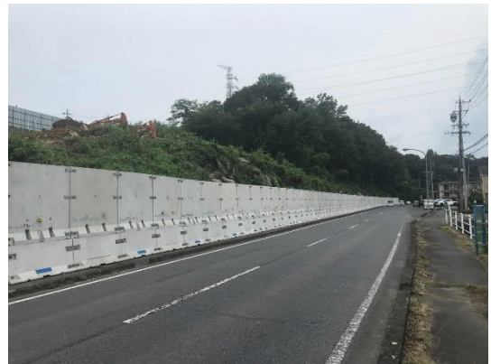
仮設落石防護柵設置完了

工事ヤードの県道側に、造成作業時の安全対策として、仮設落石防護柵を設置しました。この防護柵の設置により、歩道が今までより若干狭くなっております。歩道を通行の際はご不便をおかけしますが何卒よろしくお願いいたします。現場内ではトンネル工事施工ヤードの造成のための切土工事を行っています。切土工事とともに発生する残土は、往復100台/日にて山岡町に運搬しています。また、7月下旬より、ヤード北側部分の伐採作業も行っています。