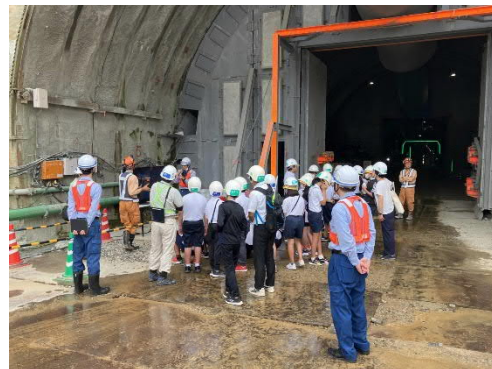
6/26 武並小現場見学（坑口にて）

6/26に武並小学校5・6年生の児童さんを対象に現場見学会を開催しました。見学会を通じてリニア中央新幹線事業や、建設業の仕事に少しでも興味をもってもらえれば幸いです。