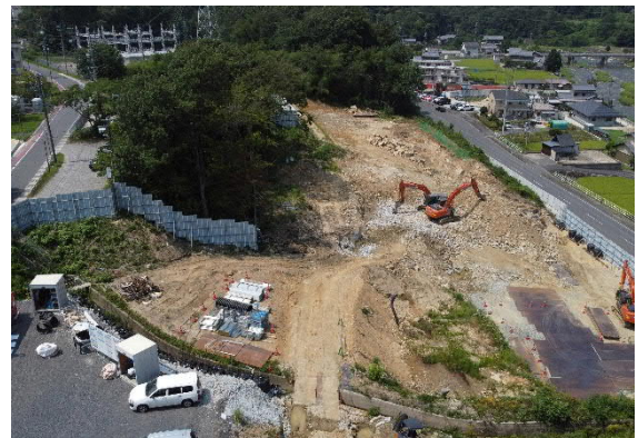
大井非常口ヤード全景

その他作業として、現場周辺の仮囲いパネルや工事車両出入口ゲートの設置などを行いました。