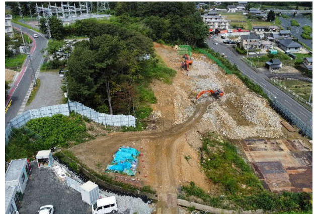
大井非常口ヤード全景

切土工事にともなって発生する土は、往復100台/日にて山岡町にダンプ運搬しています。