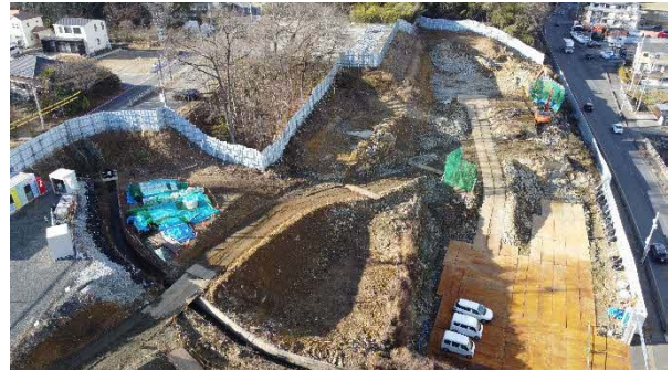
大井非常口ヤード全景

また、切土工においても低騒音型機械の使用、飛石対策ネット等の使用により、周辺環境に配慮しながら作業を行ってまいりますので、よろしくお願いいたします。