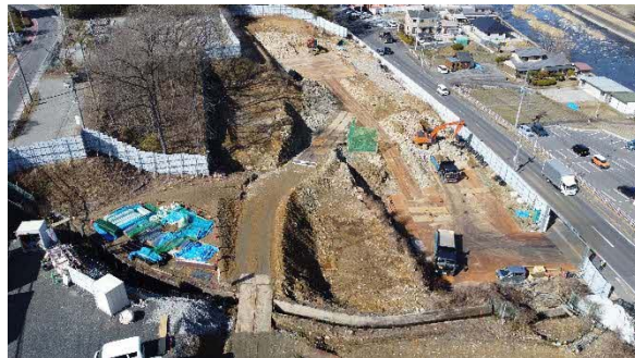
大井非常口ヤード全景

地域の皆様にはご負担をおかけいたしますが、ご理解とご協力のほどよろしくお願いいたします。