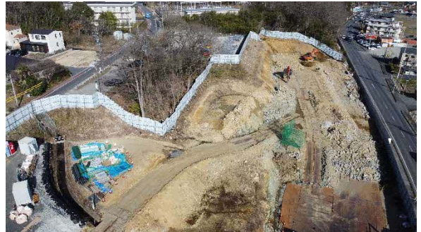
大井非常口ヤード全景

春休みも始まり、お子様たちの外出も増えるため、安全運転をより一層心がけてまいります。地域の皆様にはご負担をおかけいたしますが、ご理解とご協力のほどよろしくお願いいたします。