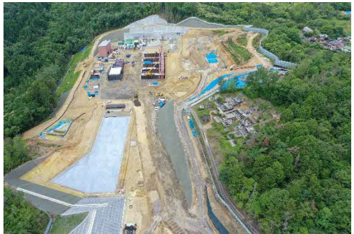
トンネル工（坑口側ヤード）