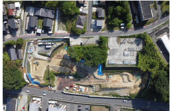
大井非常口ヤード全景（写真）

地域の皆様にはご負担をおかけいたしますが、引き続き、安全と現場周辺への環境に配慮して作業を行ってまいりますので、ご理解とご協力をお願いいたします。