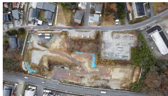
大井非常口ヤード全景（写真）

年末年始の休工は12/27（土）～1/5（月）を予定しております。（保守管理等に関する人の出入りはあります。）