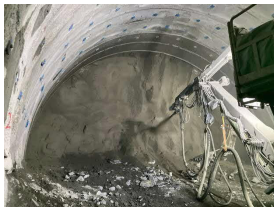
トンネル掘削作業状況 （吹付状況）

年末年始の休工は12/27（土）～1/5（月）を予定しております。（機材の点検等を行うため、保守管理等に関する人の出入りはあります。）