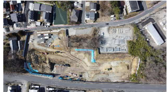
大井非常口ヤード全景（写真）